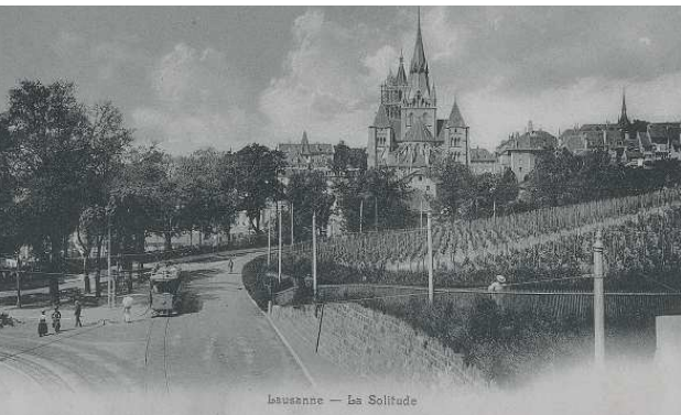
Lausanne — La Solitude